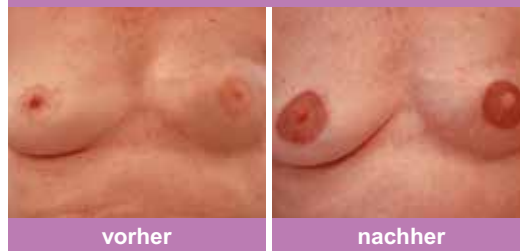
z. B. bei Mamillen-Rekonstruktion