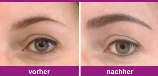
z. B. bei Augenbrauen