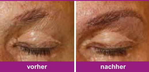
z. B. bei Augenbrauen nach Verbrennung