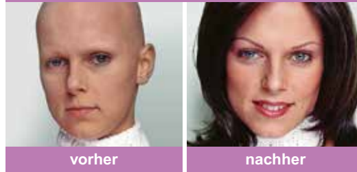
z. B. bei Alopecia areata